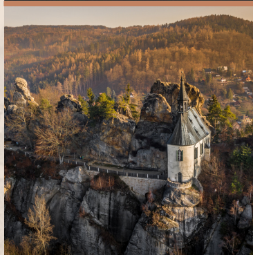
ZAMEK VRANOV - PANTHEON