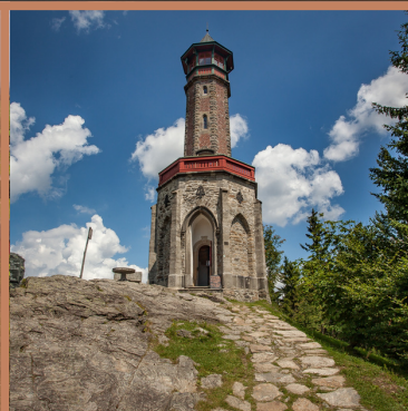
WIEŻA WIDOKOWA STEPANKA