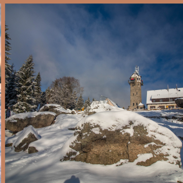
WIEŻA WIDOKOWA KRÓLOWKA