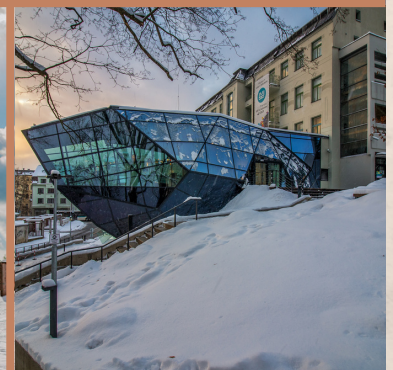
MUZEUM SZKŁA I BIŻUTERII

Witamy w Kraju Libereckim - regionie pełnym zabawy, sportu i wiedzy. Poznaj piękno regionu Macha i przyjedź na łyżwy na jezioro Macha ! Tak, to prawda! Zaletą jest to, że jezioro Macha łatwo zamarza, a dzięki swojemu położeniu rzadko pokrywa go warstwa śniegu. A więc spakowałeś już łyżwy? Góry Izerskie, zimowa duma Kraju Libereckiego. A co z Bedrichovem ? Któż nie zna międzynarodowego wyścigu Izerska pięćdziesiątka, który w tym roku rozpoczął tu swoją 56. rocznicę. Tuż przy Magistralu Izerskim można uprawiać narciarstwo biegowe. W Karkonoszach można jeździć na nartach! Rokytnice nad Jizerou czy Harrachov? Do wyboru jest kilka ośrodków zimowych i narciarskich. I bądź ostrożny, nie zapomnieliśmy też o osobach niebędących sportowcami! Mogą odkryć Křišťálové údolí w Kraju Libereckim! A gdzie indziej przypomnieć sobie wieloletnią tradycję szklarską jak nie w Muzeum Szkla i Bijoux w Jabloncu nad Nisou.